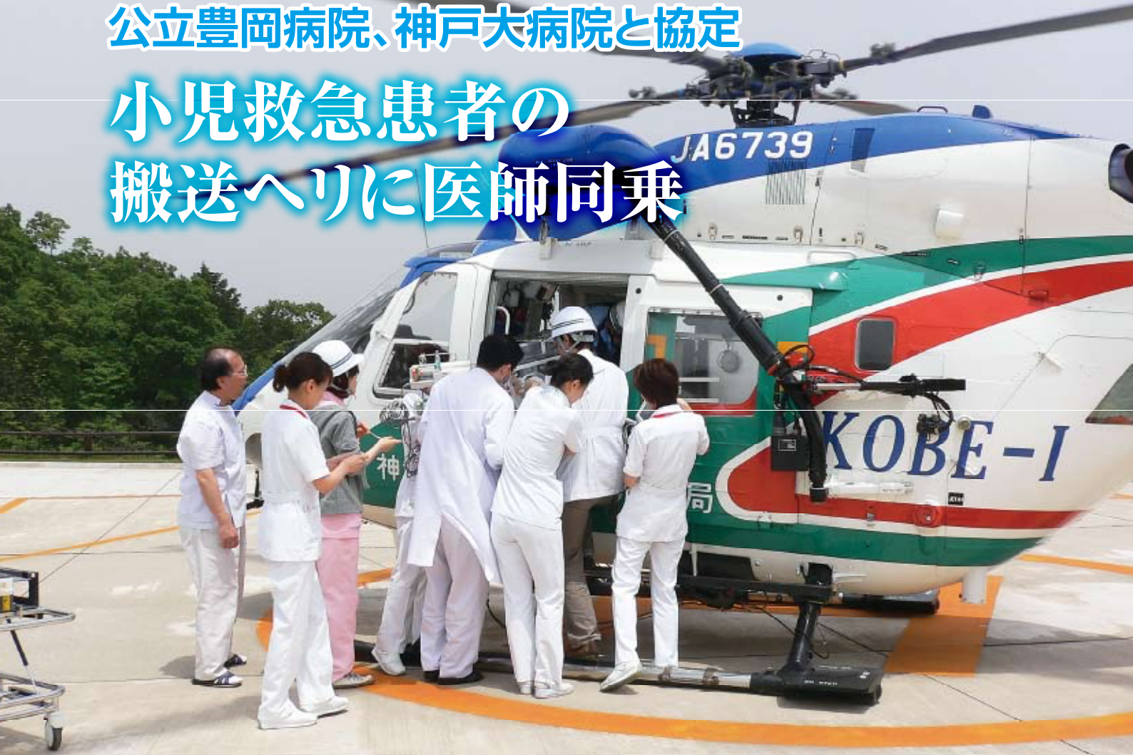
▲▼ 保育器に入った赤ちゃんを搬送する訓練の様子（公立豊岡病院ヘリポートにて撮影）

公立豊岡病院では、兵庫県消防防災ヘリコプターを利用して小児救急患者の転院搬送を行う場合に、神戸大学医学部附属病院の小児科医師が同乗することについて、同病院との協定を締結しました。調印式は、八月一日に神戸大学医学部附属病院で行われ、同日より運用開始となりました。 公立豊岡病院では、新生児や小児の重症患者の緊急治療のため、より高度な治療を実施できる医療機関に、転院していただくケースが年間十数件あります。平成十九年度にはこのような事例が十九件（うち乳児八件）あり、ほとんどの場合は救急車での搬送となつ