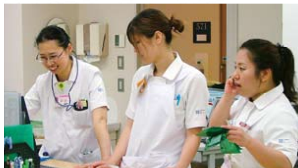
▲ 豊岡病院5-西病棟スタッフステーションにて