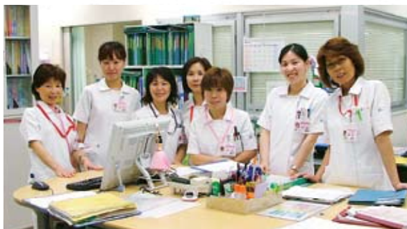
▲ 豊岡病院4-西病棟のスタッフステーションにて