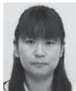
豊岡 小児科 つんざき あい 運崎 愛