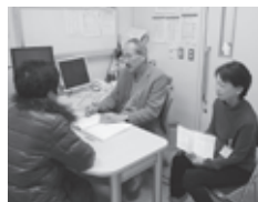
↑ 診察に同席する 精神保健福祉士 (右)

支援は、ご本人の思いを尊重し、残された力を最大限生かせるようにするとともに、ご本人だけでなくご家族、介護者を含めて支援する事が大切と考えています。また、地域での生活を支えるための医療、訪問支援や介護保険サービスの継続的な提供を視野に、介護、福祉など各関係機関との連携を図っていくことも重視しています。