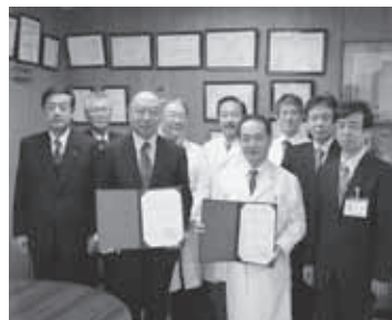
▲ 姉妹提携調印式の様子（県立尼崎病院で）

姉妹病院の友好・親善を深め、安定的・継続的な医療提供体制の確保に努めてまいります。