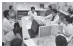
↑ カンファレンスの様子