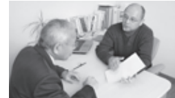
↑バウムテスト（紙に木の絵を描く心理テスト）の様子

実際に対象としている患者さんは、精神疾患を抱えた方、認知症の方、発達障害や高次脳機能障害を疑われる方などです。