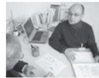
↑認知行動療法の様子

どの心理療法にも共通していることは、患者さんの健康的な力を引き出しながら、患者さん自身が悩みや問題に対処する能力を高めていくことを目標に行っています。