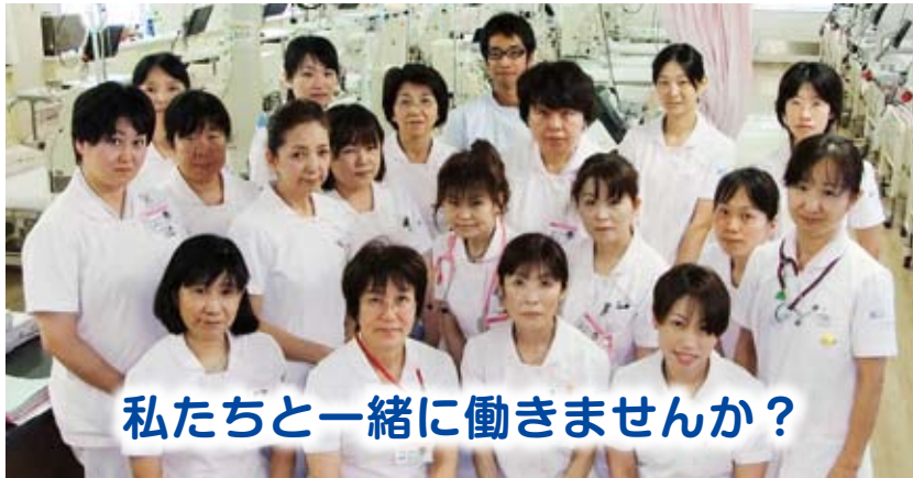
公立豊岡病院日高医療センター（透析センター）