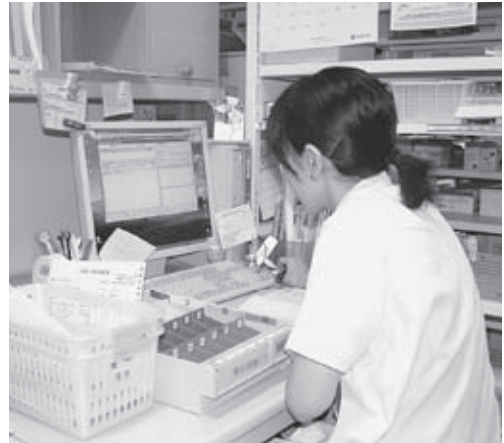
↑ 梁瀬医療センター

薬歴には、患者さま一人一人の過去の服用歴、副作用や、効果が得られにくかったことなど、多くの情報を記録します。また、複数の診療科にかかっている、それぞれの処方が適切であっても、一緒に飲むことにより身体に好ましくない作用をする場合があります。このような事態を未然に防ぐためにも、薬の情報を集約・管理しています。