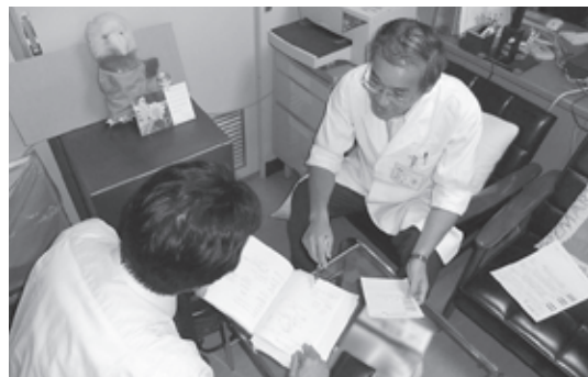
↑ 日高医療センター

医薬品の使用に際しては、それに伴う情報が不可欠です。医薬品に関する情報の収集、整理、保管、評価、提供を行っています。医師、看護師などからの医薬品に関する問い合わせに対応するとともに、製薬会社や厚生労働省、各種文献、資料などから医薬品情報を収集し、医療従事者が使用しやすい形に整理して、積極的に提供しています。