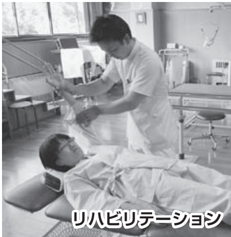
リハビリテーション

◀ 常勤の総合診療（内科）医により、一般外来診療と入院の受け入れを行っております。非常勤医師により呼吸器科・循環器科・泌尿器科・皮膚科などの外来診療もっており、専門的な検査や治療が必要な患者さまについては、公立豊岡病院などへ紹介しています。