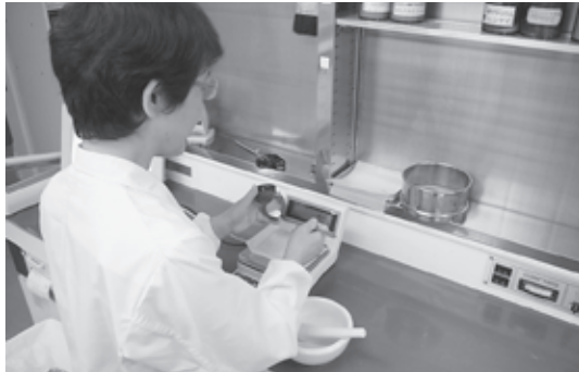
↑ 和田山医療センター

処方箋の内容について、飲み合わせ（相互作用）※・副作用・用量・飲み方などのチェックを行い、患者さまに必要な薬を調剤します。粉薬などは何種類も混ぜ合わせたり、1回ごとに分包したり、患者さま一人一人に適した形でお渡ししています。また、必要に応じて、軟膏、坐薬など病院独自の薬品を製剤しています。