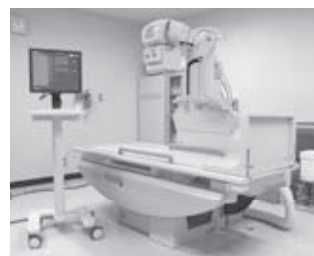
▲ 梁瀬医療センター