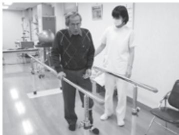
↑ 出石医療センター

平行棒内歩行やつえを使った歩行など、段階を踏みながら、安全な歩行能力向上の訓練を行います。また、歩行器やつえなどの歩行補助具の検討も行います。