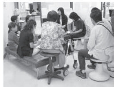
▲ 前回の様子（平成23年9月）

TEL：0796-42-1611（15時から17時15分までにお電話ください。）