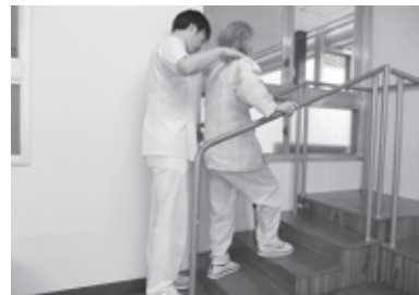
↑ 日高医療センター

自宅や外出先の階段、バスの乗り降りなどに対応できるよう階段昇降訓練を行い、活動範囲の拡大を目指して訓練を行います。