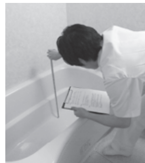
↑ 和田山医療センター

また、退院後に通院でのリハビリが困難な方に対し、自宅でリハビリを受けることができる訪問リハビリを行うこともあります。