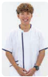
クリティカルケア認定看護師