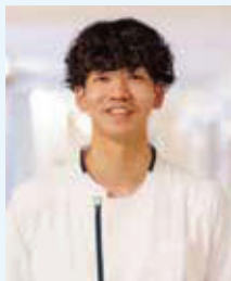
三方 ■5階東(脳神経内科病棟) ■出身校:公立八鹿病院看護専門学校

急性期医療に携わることで、より多くの患者さんに迅速かつ適切な医療を提供できることに魅力を感じ入職。現在はプリセプターとして、実際の業務を通じて技術指導するとともに、仕事の進め方や病院の方針についてもサポートしています。