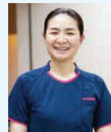
安積 ■3階西(呼吸器・心臓血管外科、循環器内科病棟) ■出身校:兵庫県立日高高等学校専攻科

家族やまわりの人たちが豊岡で安心して医療が受けられるためにもっとできることはと思い、急性期病棟や救急病棟に勤務した経験から、救急看護認定看護師を目指しました。認定看護師として、多部署での急変勉強会や急変の振り返り、