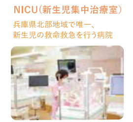
NICU(新生児集中治療室) 兵庫県北部地域で唯一、新生児の救命救急を行う病院

妊娠期の外来からハイリスク分娩までトータル支援 「こうのとりの周産期センター」 (外来/病棟/NICU) 妊娠期の外来から分娩・産褥・育児までトータルで支援できる体制を整えています。助産師外来や乳児健診を実施する中で、赤ちゃんとお母さんに優しい看護を提供しています。