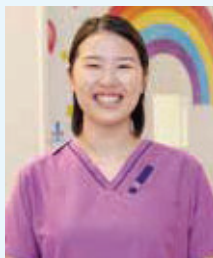
絹本 ■3階南(産婦人科病棟) ■出身校:兵庫県立総合衛生学院 助産学科

都市部の基幹病院でハイリスク妊産婦について学び、その後、他院でローリスク妊産婦や院内助産について学んだのち、「地元である豊岡病院に入職し但馬の周産期に携わりたい」と、当院へ。アドバンス助産師の研修で得た知識は、看護の現場だけではなく後輩助産師の指導にも活用しています。より幅広い視野を持ち、妊産婦さん一人一人のニーズに合わせた看護を提供し、携わる全ての女性を支えていくことがアドバンス助産師の使命です。